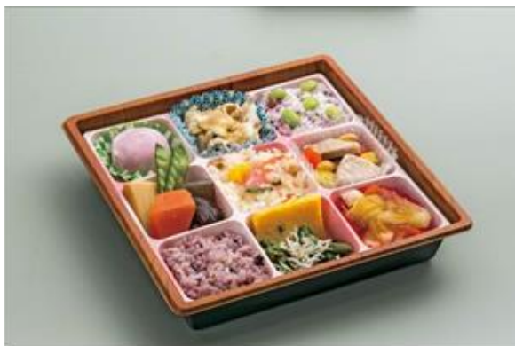
商品化された「春のひだまり弁当」