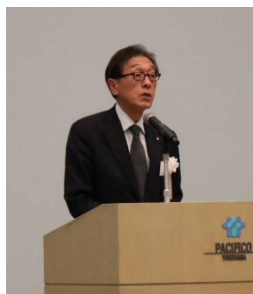
太田教育文化委員会委員長による最優秀賞の発表